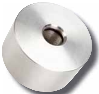
Drei Edelstahlgewichte gehören zum Lieferumfang. Ein eingelegter O-Ring sorgt für Bedämpfung