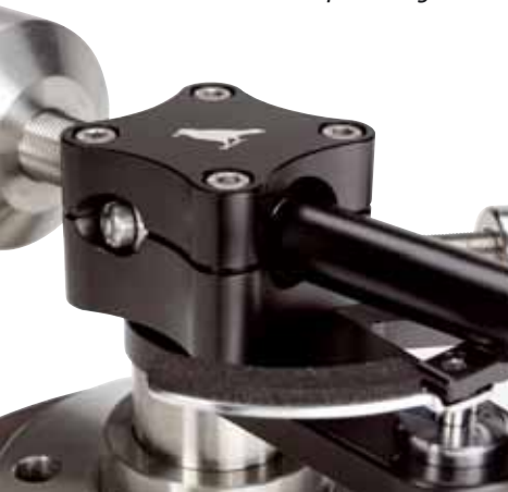
Das Lagergehäuse des Tonarms ist von der Form her an die Laufwerksbasen der Raven-Plattenspieler angelehnt

Das übrigens ist eine hervorragende Idee und statisch deutlich besser als jede simple Klemmung ohne zusätzliche Führung.