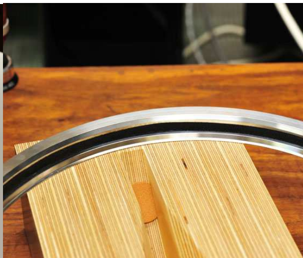
Le bord de l'anneau fait 0,5 mm d'épaisseur !

All NASOTEC products, prices and specifications are subject to change without notice. Les prix, désignations et spécifications des produits NASOTEC sont données à titre indicatif.