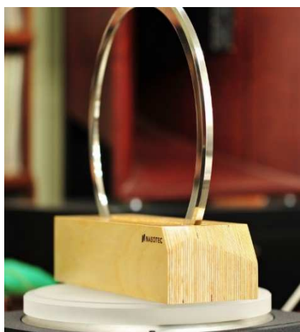
Anneau sur son Support (optionnel)

Excellente adaptation aux disques standards de 30 cm de diamètre, permettant d'anéantir un éventuel voilage pour une lisibilité optimum de la cellule.